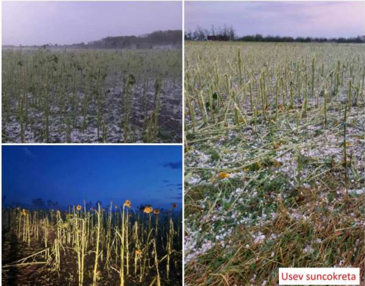
SLIKA 1. USEV SUNCOKRETA POGOĐEN JUČERAŠNJIM NEPOGODAMA

UZ NAVEDENE PREPARATE JE PREPORUKA DA SE PRIMENE I PREPARATI NA BAZI AMINOKISELINA KOJI PODSTIČU BILJKE DA SE IZBORE SA STRESNIM USLOVIMA KOJI SU NASTALI ZBOG POVREDA TKIVA NAKON GRADA.