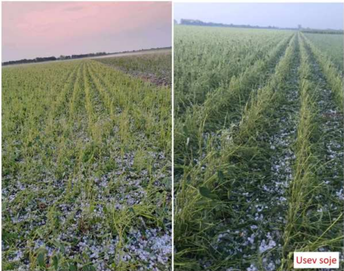
SLIKA 2. USEV SOJE POGOĐEN JUČERAŠNJIM NEPOGODAMA