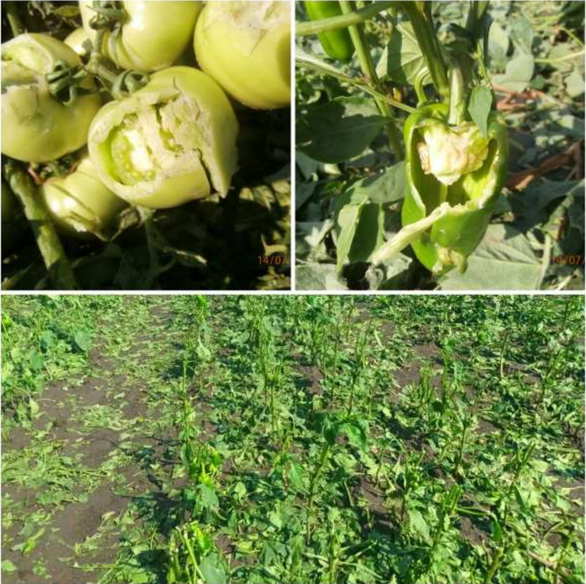
SLIKA 4. USEV PAPIRIKE POGOĐEN JUČERAŠNJIM NEPOGODAMA