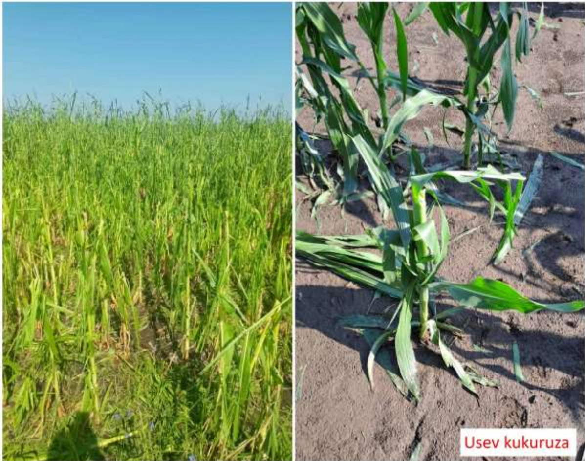
SLIKA 3. USEV KUKURUZA POGOĐEN JUČERAŠNJIM NEPOGODAMA