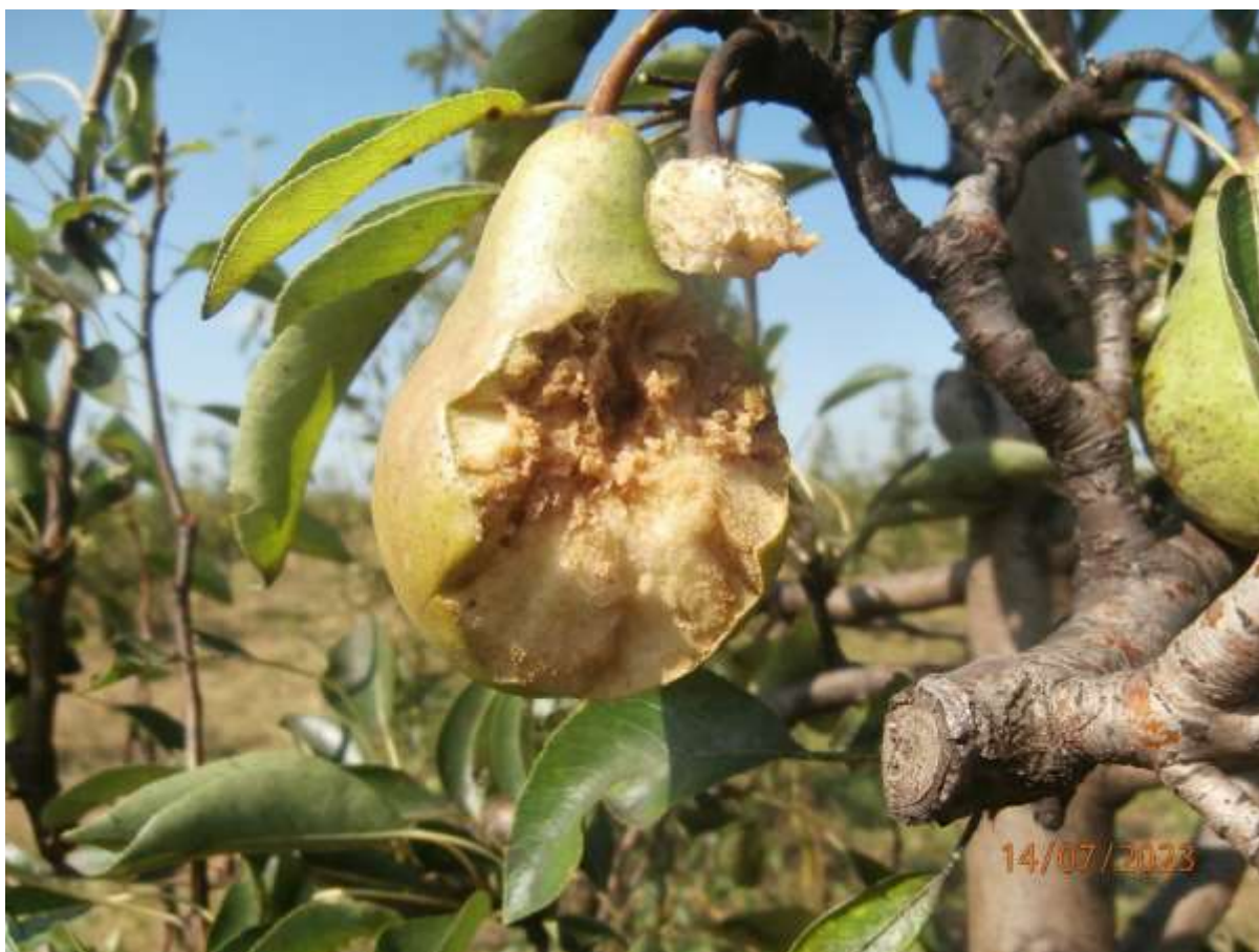
SLIKA 5. ZASAD KRUŠAKA POGOĐEN JUČERAŠNJIM NEPOGODAMA