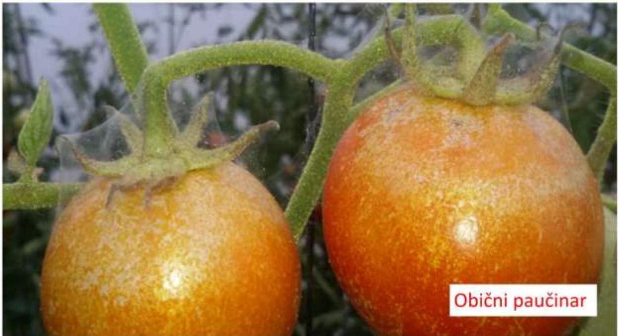
SLIKA 4. OBIČNI PAUČINAR NA PARADAJZU