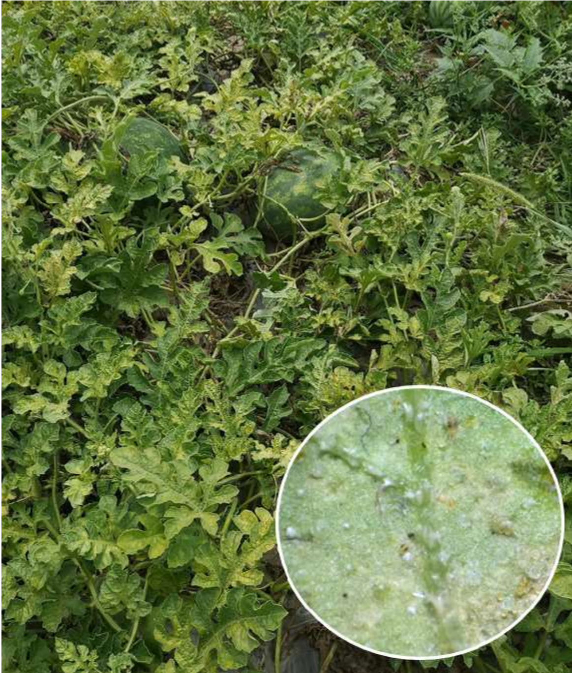
SLIKA 3. OBIČNI PAUČINAR NA LUBENICI