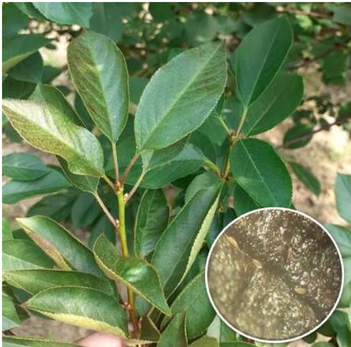
SLIKA 2. RĐASTE GRINJE NA VIŠNJI