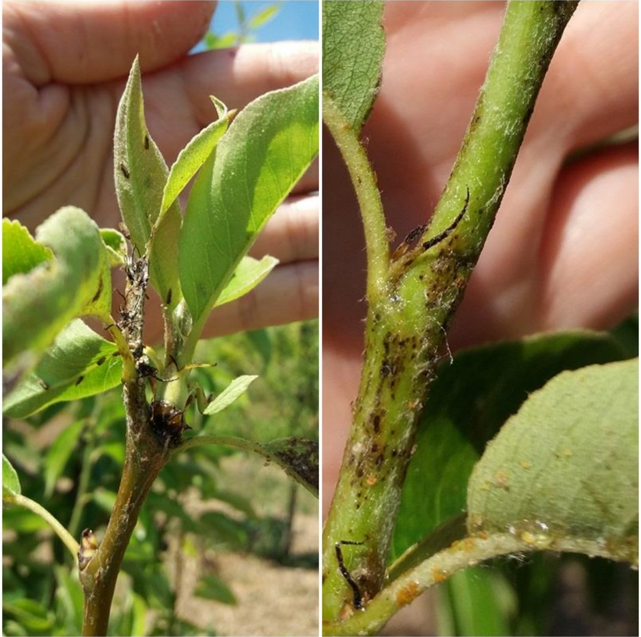
SLIKA 5. ODRASLE JEDINKE I LARVE OBIČNE KRUŠKINE BUVE