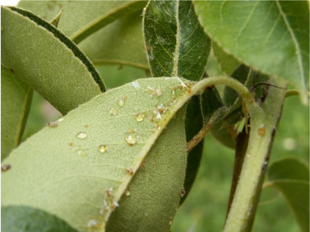
SLIKA 3. KAPI MEDNE ROSE NA NALIČJU LISTA U OKVIRU KOJIH SE NALAZE LARVE OBIČNE KRUŠKINE BUVE