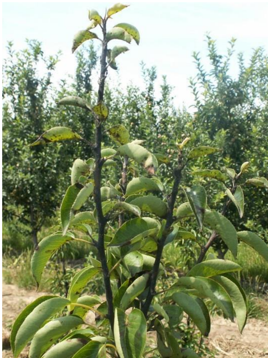
SLIKA 6. MLADARI KRUŠKE PREKRIVRENI GLJIVOM ČĀĎAVICOM