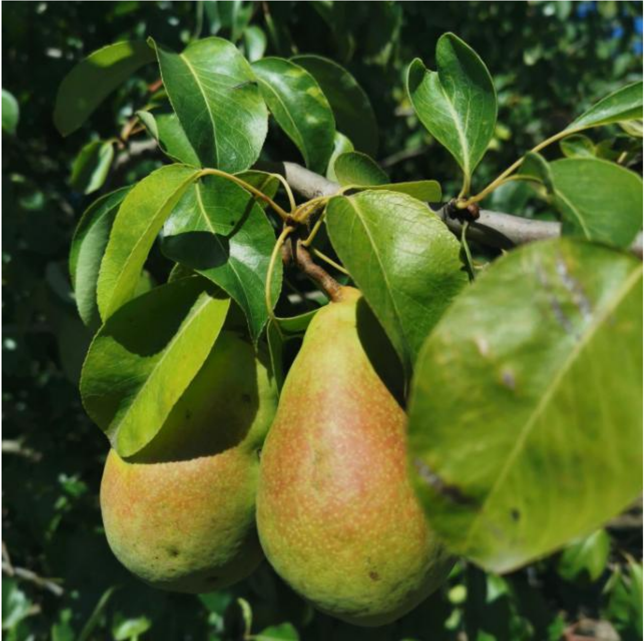
SLIKA 1. FAZA RAZVOJA VODEĆE SORTE KRUŠKE: VILJAMOVKA