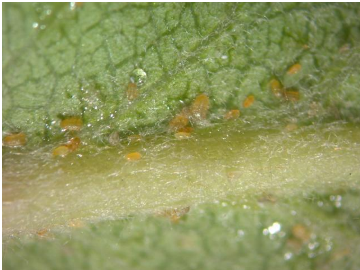
SLIKA 2. LARVE OBIČNE KRUŠKINE BUVE U MEDNOJ ROSI NA NALIČJU LISTA